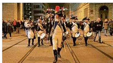
Průvod Vyrazí v sobotu 24. 11. v 17.00 od kostela sv. Tomáše.

Průchod Napoleona Brnem zahájí sérii vojenskohistorických akcí, které se konají ve Slavkově u Brna, Křenovicích, Sokolnicích nebo Vyškově. Brno pak zažije vojenský pochod ještě jednou, ve čtvrtek 29. listopadu se uskuteční setkání v Denisových sadech. (zab)